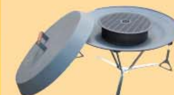
Feuerstelle + Barbecue + Deckel, 0 945 € 168,00