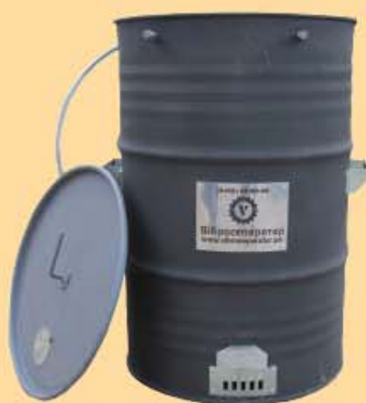
RÄUCHERTONNE € 168,00