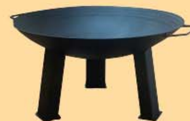
Feuerschale mit Beinen, 0 600 € 36,00