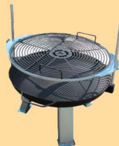
Feuerschale mit Grill Funktion € 72,00