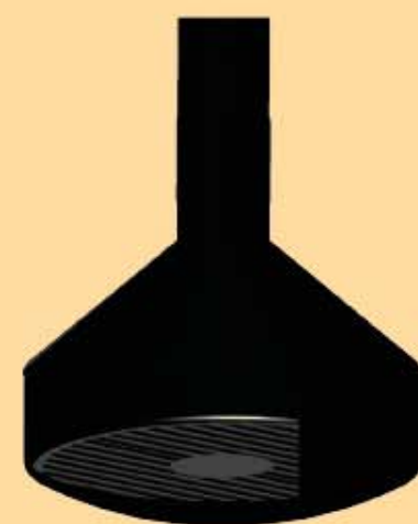
Hängekamin drehbar € 540,00