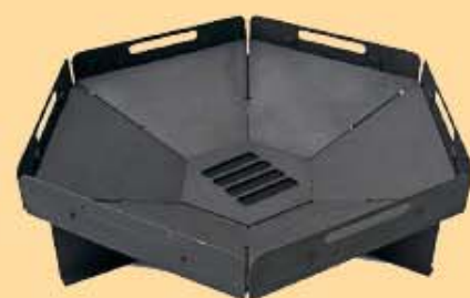
Feuerschale € 144,00