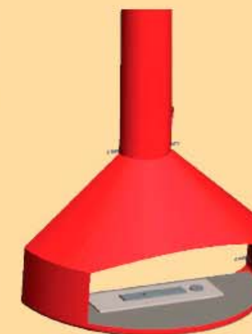
Dekoratив Wand biokamin € 420,00