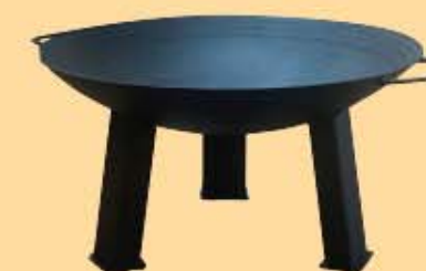
Feuerschale mit Beinen, 0 800 € 42,00