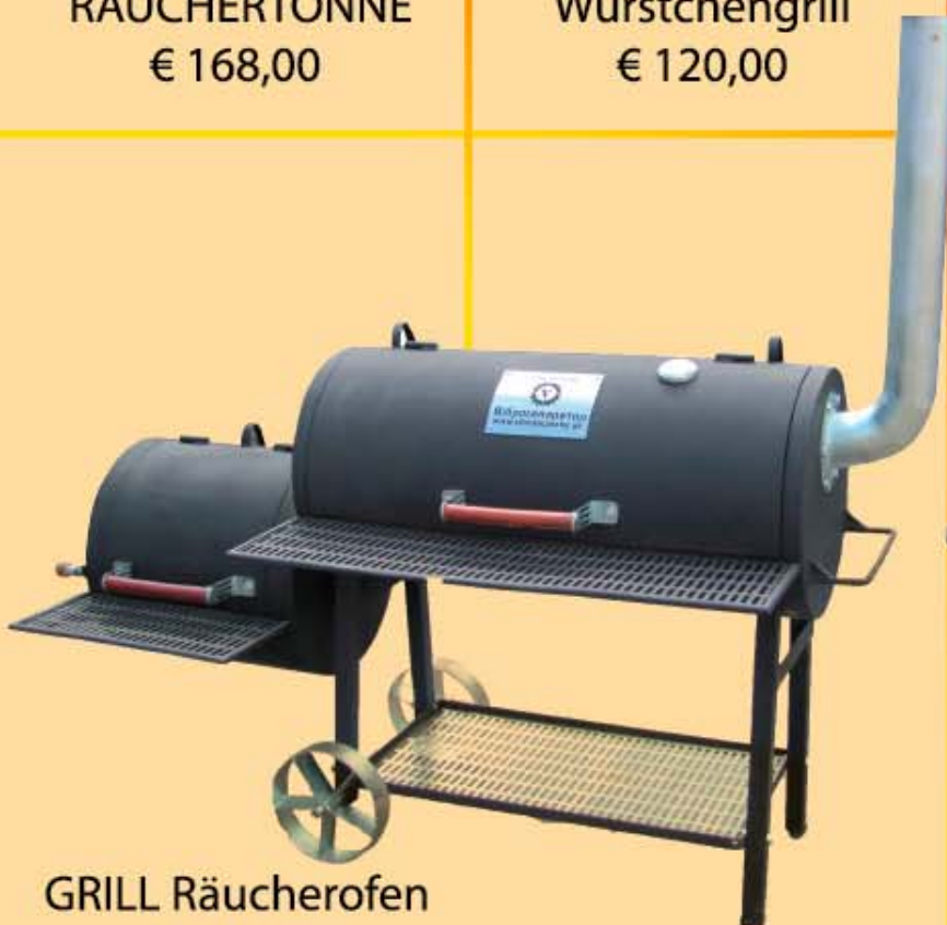
GRILL Räucherofen € 420,00