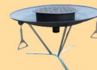
Feuerstelle + Barbecueerost € 160,00