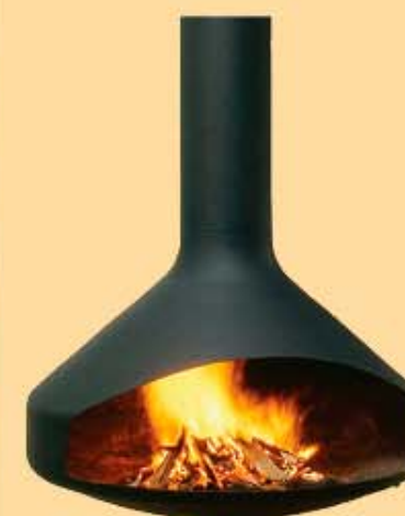
Biokamin aufhängbar € 422,40