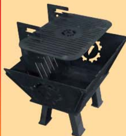
Wurstchengrill € 120,00