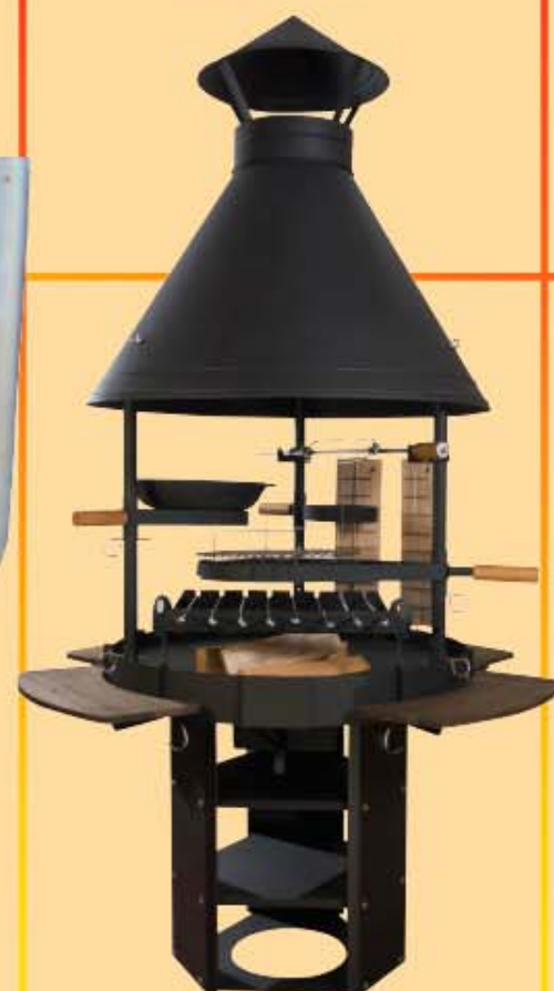
Grill-Station "CHEF" € 828,00