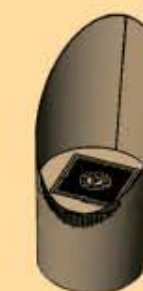
Dekorative Feuerstelle € 72,00